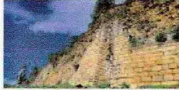
Fortaleza Kuélap. M. Dauriol.

Esta iniciativa contribuye al desarrollo del turismo rural en Kuélap y a la difusión de su potencial turístico como cultural a través de la realización de documentales.