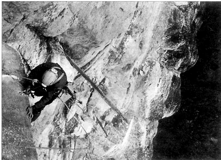
DESCENSO. Los espeleólogos tuvieron que utilizar técnicas de escalada para llegar a la «barreta de oro».

descubierta en 1843 en el corazón de la selva.