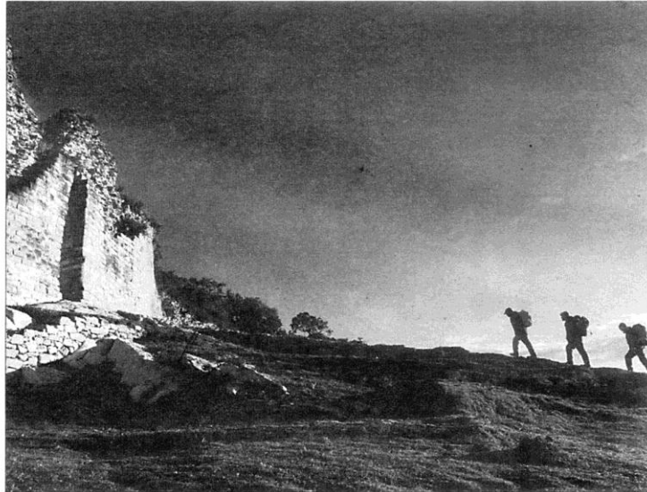
KUÉLAP. Miembros de la expedición se dirigen a la ciudad fortificada con muros de hasta veinte metros de altura.

■ El bombero castellanense ha revolucionado la arqueología andina con sus técnicas