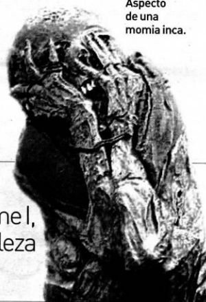
Aspecto de una momia inca.

Castellón revoluciona la arqueología andina. El equipo que trabaja en el proyecto Ukhupacha, financiado casi íntegramente por la Universitat Jaume I, descubre enterramientos de autoridades chachapoyas en la recóndita fortaleza de Kuélap, al norte de Perú, gracias a sus técnicas de progresión vertical.