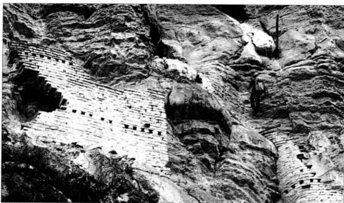
Construcciones en la zona de la 'Barreta', que según la leyenda estaba cubierta de oro.

DESCUBRIMIENTO EXPEDICIÓN CIENTÍFICA A KUÉLAP