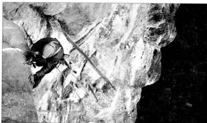
Escalada por la montaña sagrada (3.000 metros) de uno de los miembros de la expedición.