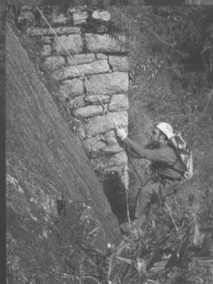
Ascenso de uno de los muros incas del camino de la Garganta.