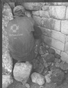
Desobstrucción de una cbinkana en la ciudadela.