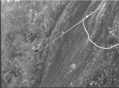
Trabajos de instalación en el camino de la Garganta.