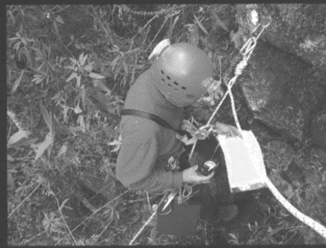
Un geólogo toma datos de una pared del pequeño Huayna Picchu.

cibiendo por parte de la universidad. Allí tuvimos diversas reuniones con otras universidades e instituciones peruanas, durante las cuales se firmaron varios convenios de colaboración.