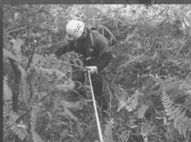
Acceso al camino del Huayna Picchu.

Línea de vegetación formada por el supuesto camino del Huayna Picchu.