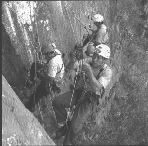
Prácticas durante el curso impartido a los trabajadores del INC.