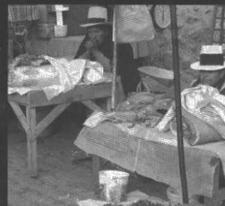
Vendedoras de carne en la calle.