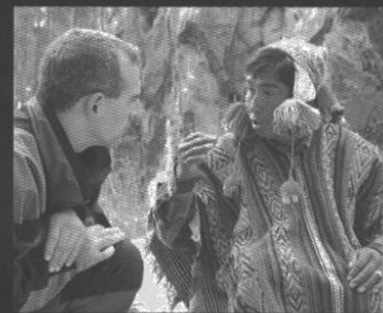
Pago de la Pachá Mama en Sacsayhuamán.