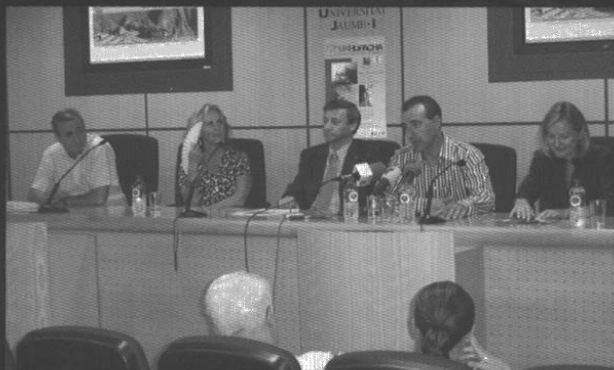
Rueda de prensa en la Universidad Jaime I de Castellón.