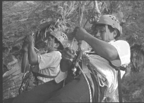
Prácticas durante el curso impartido a los trabajadores del INC.