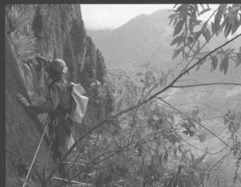
Trabajos de instalación en la pared del Huayna Picchu.