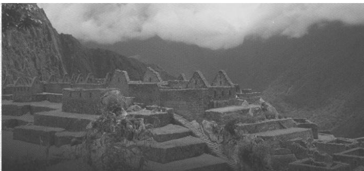
Ciudadela del Machu Picchu.

A mediados del mes de septiembre aterrizábamos nuevamente en el aeropuerto internacional Jorge Chávez de la ciudad de Lima. El equipo técnico lo formábamos ocho espeleólogos y una estudiante de arqueología, aunque en esta ocasión nos acompañaban también el Rector, la Vice-rectora y un Catedrático de la Universidad Jaime I de Castellón, afianzando así aún más si cabe, el gran apoyo que estábamos re-