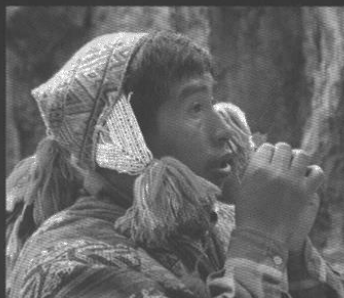
Pago de la Pachá Mama en Sacsayhuamán.