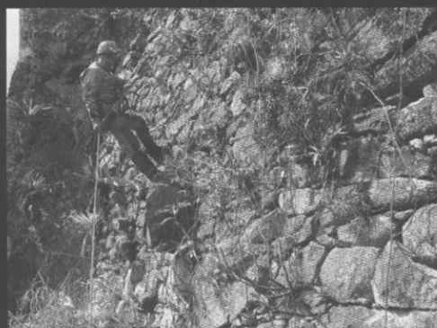
Descenso de uno de los muros incas del camino de la Garganta.